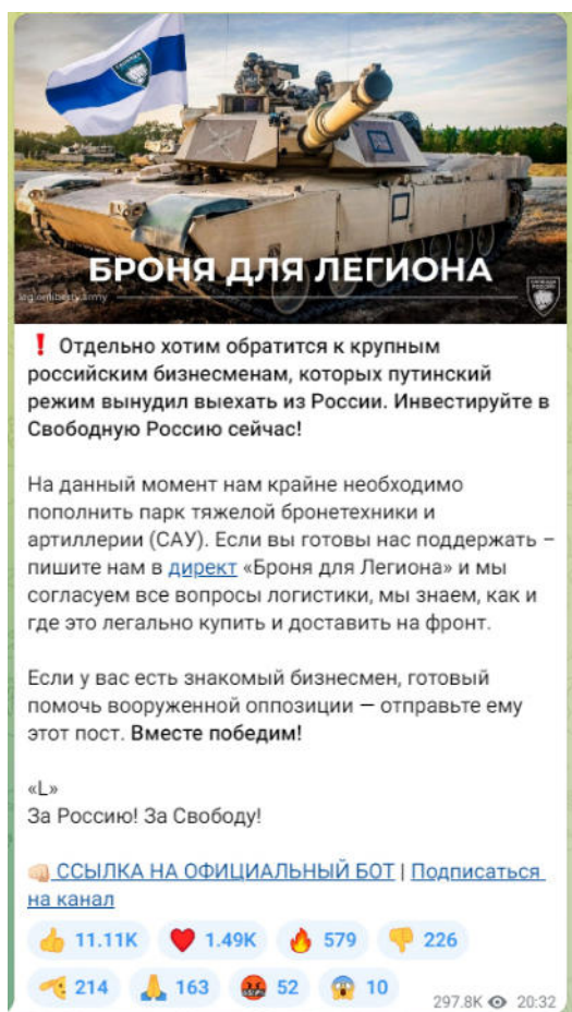
Рисунок 3 — Скриншот телеграм-канала легиона «Свобода России» с призывом к финансированию

Важно подчеркнуть, что помимо собственно пропаганды и распространения идеологии террористических организаций, а также вовлечения в деятельность террористических организаций существует еще одна угроза террористического характера — ложные сообщения о готовящемся террористическом акте. Только за 2021 год зафиксировано более 4,5 тысяч ложных сообщений о готовящихся терактах на объектах социальной инфраструктуры. Это может быть хулиганство, злой умысел, специфическое чувство юмора, желание проверить качество работы правоохранительных органов или антитеррористическую защищенность объекта и др. Во всех вышеперечисленных случаях за такой поступок придется нести уголовную ответственность. Ведь злоумышленник нарушает конструктивную деятельность общественных объектов, а правоохранителям приходится задействовать множество средств и сил, чтобы проверить объекты, которые якобы находятся под угрозой. За ложное сообщение о готовящемся теракте правонарушитель может быть наказан либо штрафами – от 200 тысяч рублей и до двух миллионов рублей, либо лишением свободы – от одного года до 10 лет. Ответственность за данный вид правонарушения наступает с 14 лет (статья 207 УК РФ «Заведомо ложное сообщение о акте терроризма»).