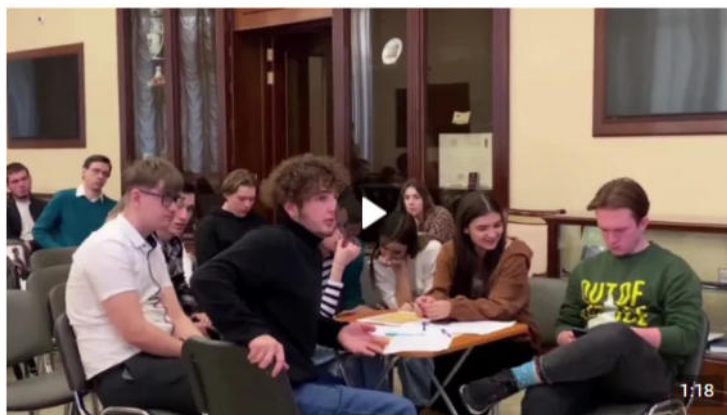
Дебаты «Идеология радикальных организаций» 1 888 просмотров

В рамках дебатов можно: развенчивать мифы, декларируемые представителями радикальных идеологий для вербовки; развивать навыки критического мышления и ведения дискуссии; формировать в целом антитеррористическое сознание и активную гражданскую позицию. Рекомендуется для мероприятия вовлекать не более 20 человек (см. рисунок 5).