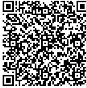
Рисунок 7 — Сценарий тематической викторины с примерами вопросов

В каждом из перечисленных мероприятий важно отслеживать активность участников, высказываемыми ими мнения, их настрой в целом. На таких мероприятиях необходимо присутствие психолога для фиксации активности и оценки их поведения.